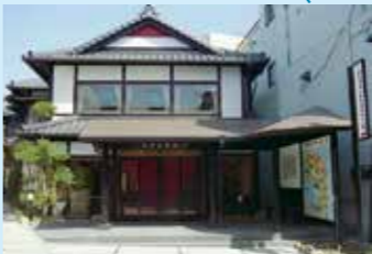
7 故鄉交流館 作為觀光問訊處、土特產銷售處、免費休息處利用。 ☎0823-42-4871 閉館日 每週週一 (周一逢節假日時順延至次日閉館)