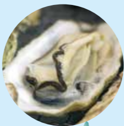
江田島的美味：牡蠣