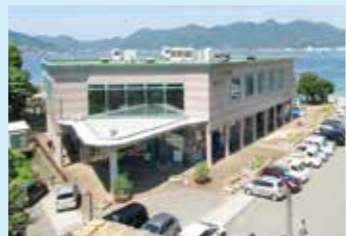
2 海邊溫泉能美(NOUMI) 從浴池觀海景特別好，治癒心中的疲勞。 ☎0823-40-2080 閉館日 每週週三