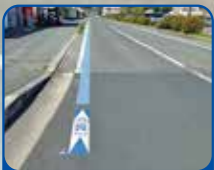
自行車道上劃著藍色線。