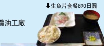
6 海邊的新鮮市場 銷售土特產，供應新鮮的魚菜。 ☎0823-40-0170 閉館日 每週週一 (周一逢節假日時順延至次日閉館)