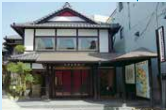
7 후루사토 교류관 관광안내소·특산품 판매소·무료로 휴게할 수 있습니다. ☎0823-42-4871 휴관일 매주 월요일 (월요일이 국경일 때는 다음 날)