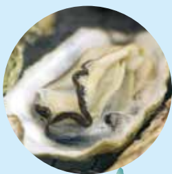
에타지마 명물 굴