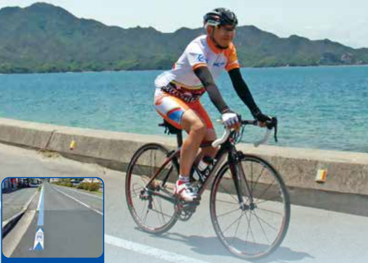
사이클링 로드엔 파란 선이 그려져 있습니다.